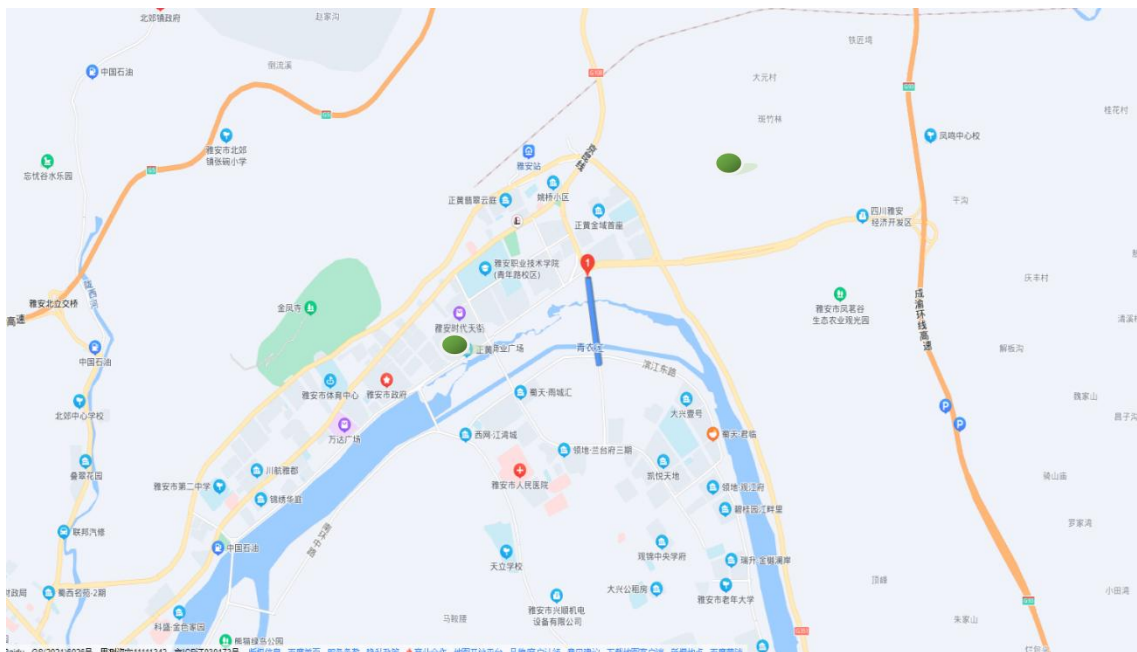
图 1.1-1 项目所涉区域示意图

雅安市大兴二桥工程位于雅安市雨城区东侧，连接姚桥片区和大兴片区，桥梁上跨青衣江。雅安市位于四川盆地西部边缘与青藏高原的过渡地带，自古就是我国内地沟通西藏、云南边疆的交通要塞、军事要地、民族走廊和商品集散地。是古代南丝绸之路的主要通道。项目区中心地理位置坐标：东经 103^{\circ}03'38.75'' ，北纬 30^{\circ}01'04.61'' 。项目所涉区域见下图：